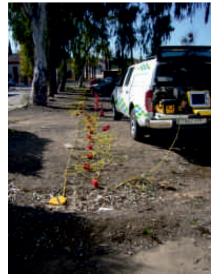
Localización en la zona de estudio de las posibles anomalías asociadas al acueducto.