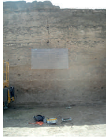
Estudio de la Muralla del Marrubial con GPR.