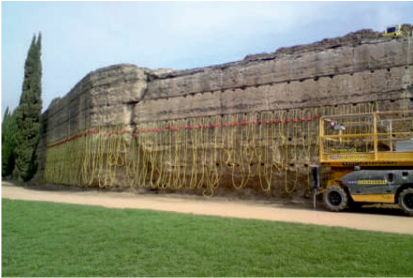
Estudio de la Muralla del Marrubial con Tomografía eléctrica.

Este estudio combinado es una herramienta muy eficaz para estudiar la geometría y extensión de ciertas patologías, tales como grietas y fracturas, y también para detectar zonas con acumulación de humedades.