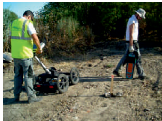
Imagen tomada durante la inspección de la zona de estudio con antena de Geo-radar de 250 MHz y con busca-cables.