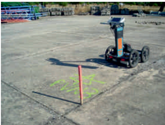
Posición elegida para un punto de sondeo.