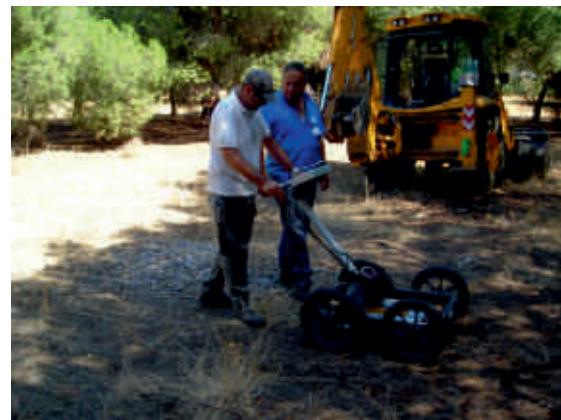
Imagen tomada durante la inspección de la zona de estudio con antena de Geo-radar de 250 MHz.