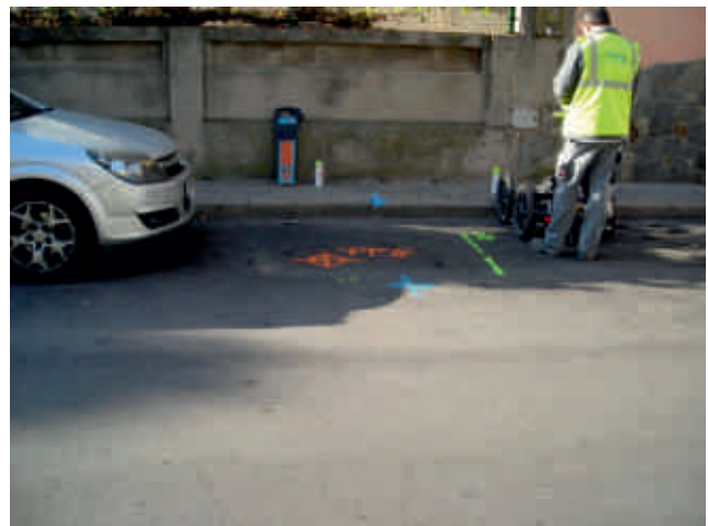
Imagen tomada durante la inspección de la zona de estudio con antena de Geo-radar de 250 MHz.